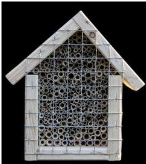
Wildbienennisthilfe aus Pappröhren