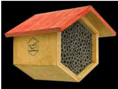
Nisthilfe mit Pappröhrchen