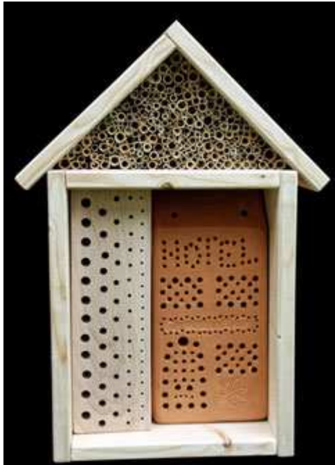
Wildbienennisthilfe mit Hartholzblock, Schilfhalmen und Niststein