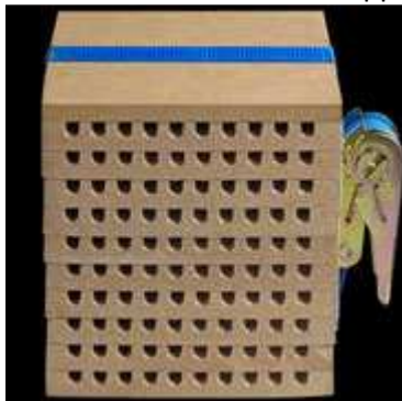
Zerlegbare Nisthilfe aus zerlegbaren Nutbrettchen