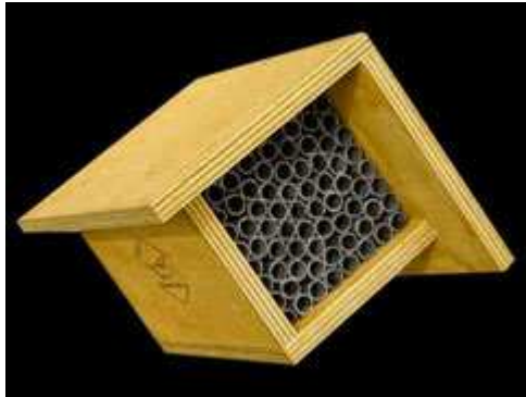
Nisthilfe mit Pappröhrchen