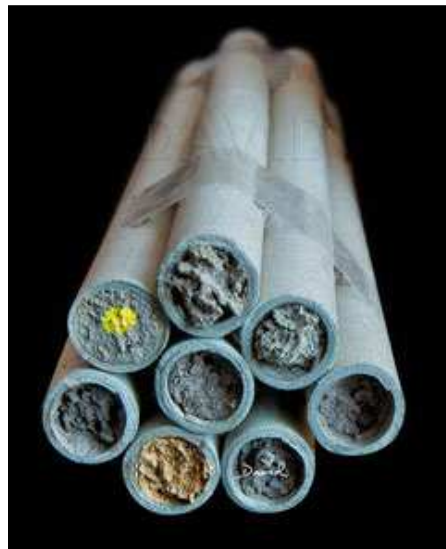
Wildbienennisthilfe mit Schilfhalmen