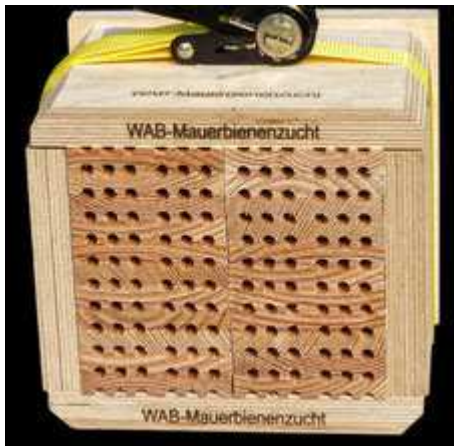
Zerlegbare Nisthilfe aus gestapelten Nistbrettchen