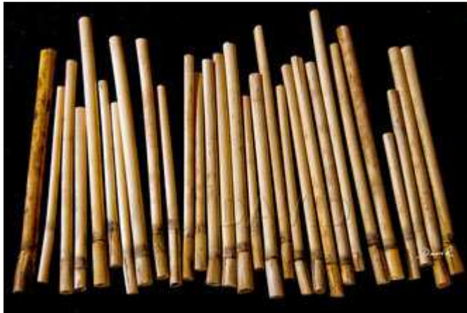
Geschnittene Schilfhalme als Nistmaterial