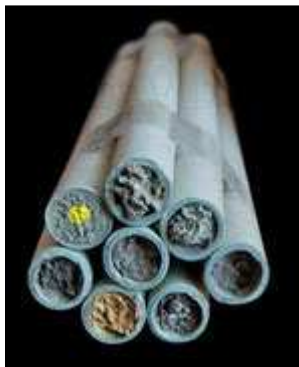
Pappröhrchen als Nisthilfe